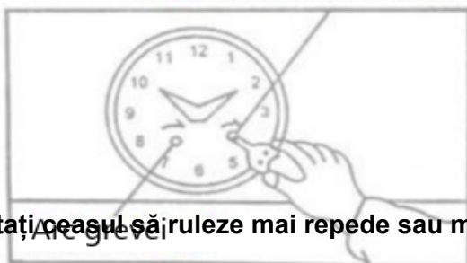
Arcul ceasului mașinărie

Pentru a porni ceasul, mutați pendulul în poziția exterioară dreaptă sau stângă și eliberați-l (vezi figura 5). De îndată ce pendulul începe să se balanseze în mod regulat, ceasul ar trebui să înceapă să bifeze normal.